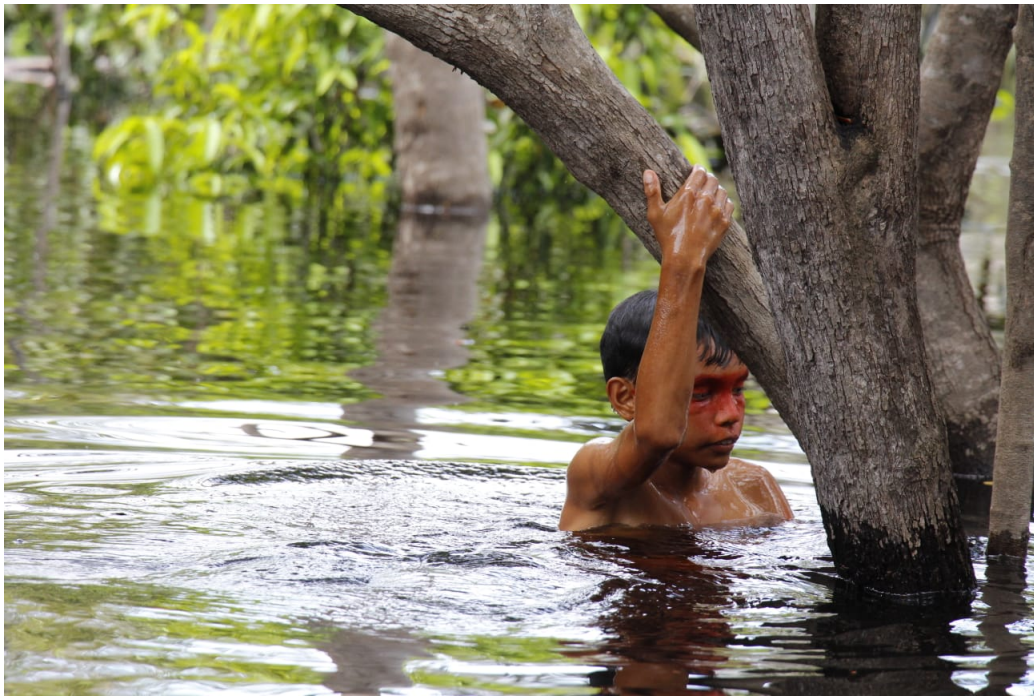
FIGURE 2 – « Garçon Kambeba ».

Flèches de taquara Pointant vers un chemin sans fin Des siècles de violence Je plains mon curumim.