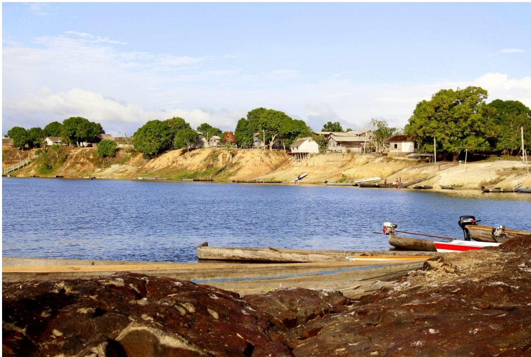
FIGURE 4 – « Communauté ».

Je dis non ! Au viol de la nature Par tous ceux qui abusent dans la certitude de rassasier leur vanité, leur consommation exagérée Où peu ont beaucoup et beaucoup ont peu Tant que nous ne créons pas d'appartenance avec l'endroit Le pays va continuer à s'embrouiller, à reculer Devenir le pays du roi du bétail. Et le peuple de la forêt continue à vivre enfermé Sans paix, dans la peur.